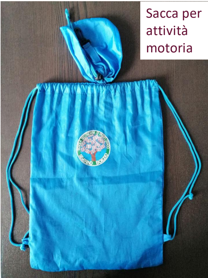
Sacca per attività motoria