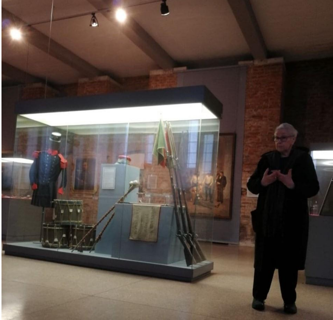
Visita al Museo del Risorgimento

Attività di Orientamento con esperti on line e in presenza