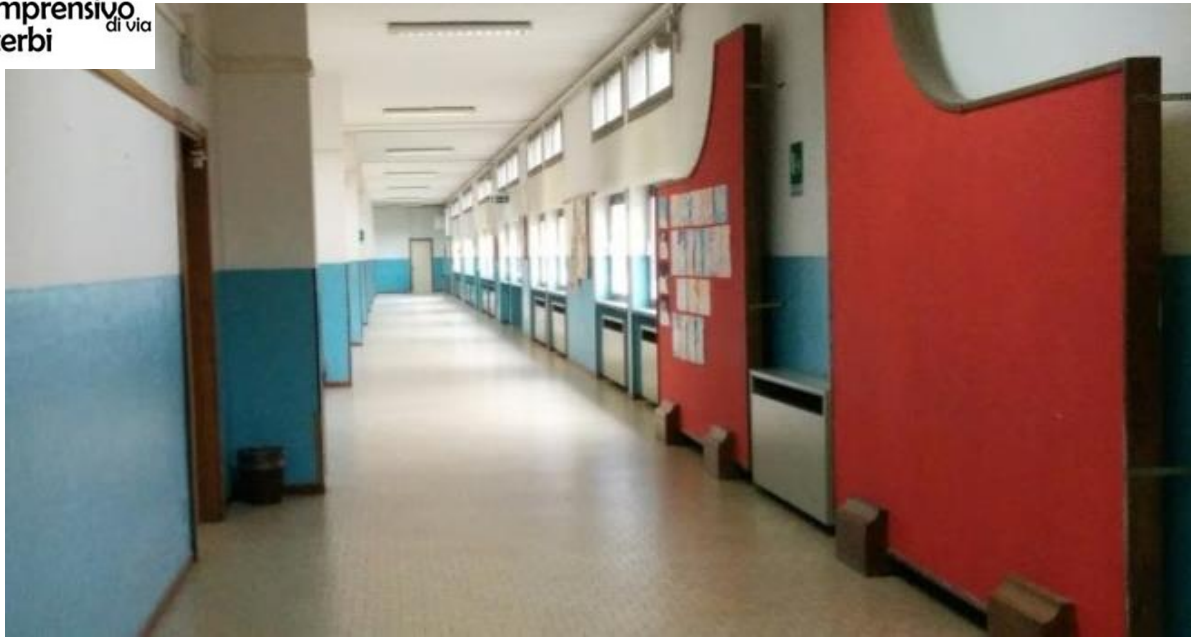
Gli spazi interni