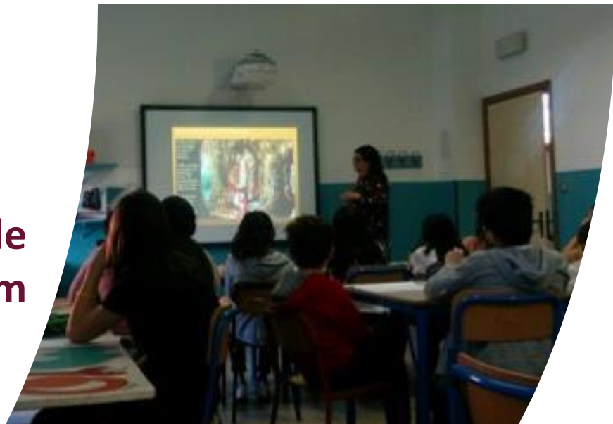
Tutte le aule hanno la lim