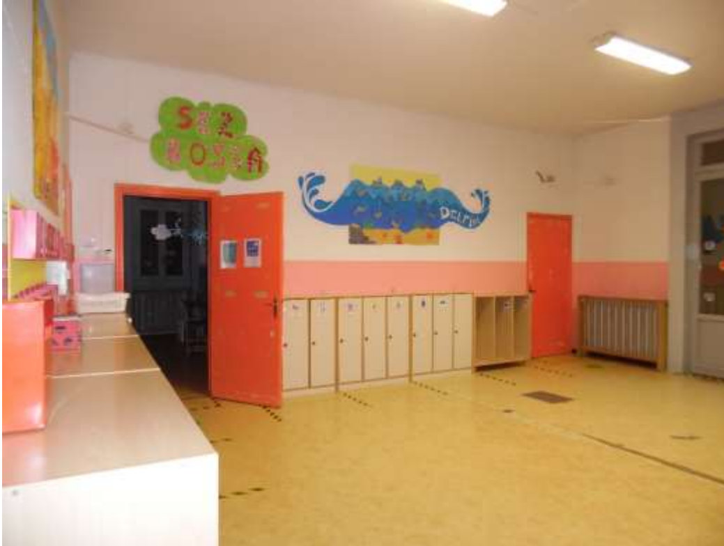
Il salone visto da sinistra