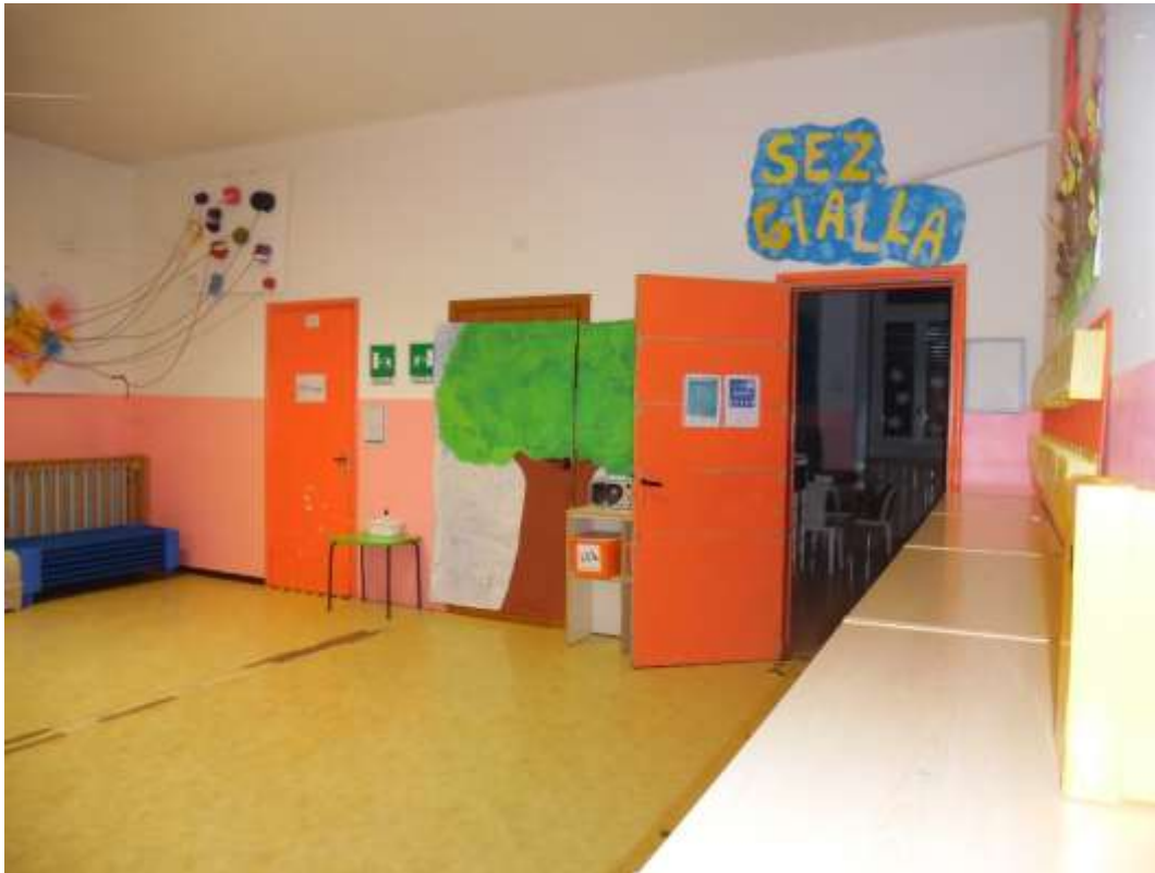
Il salone visto da destra