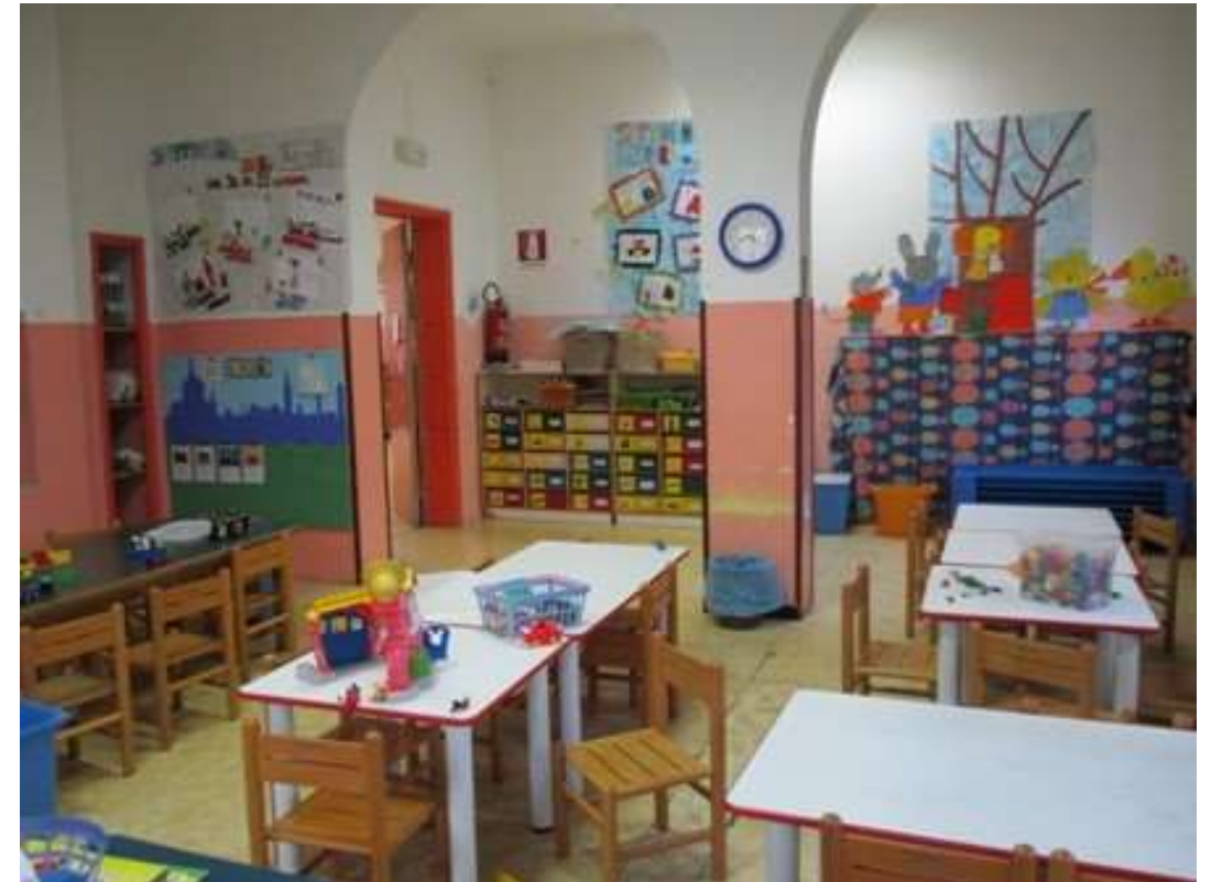
La sezione GIALLA