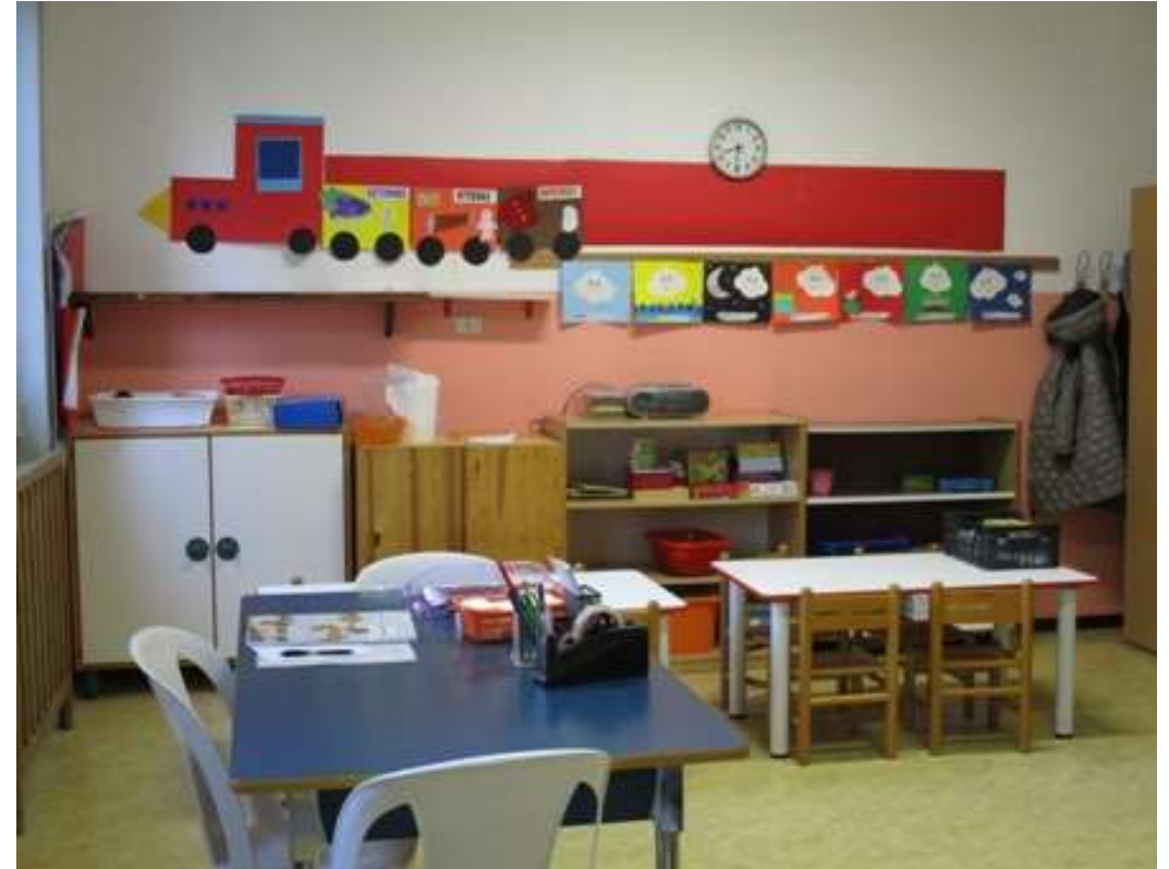
La sezione ROSSA