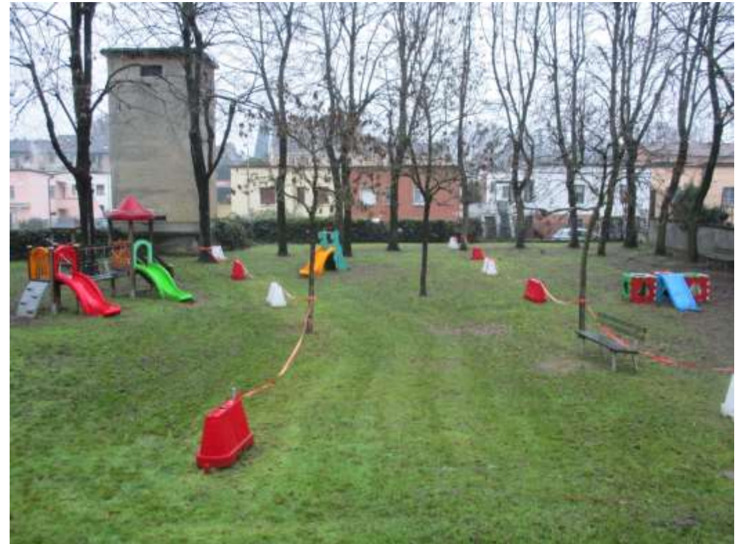
Il nostro GIARDINO